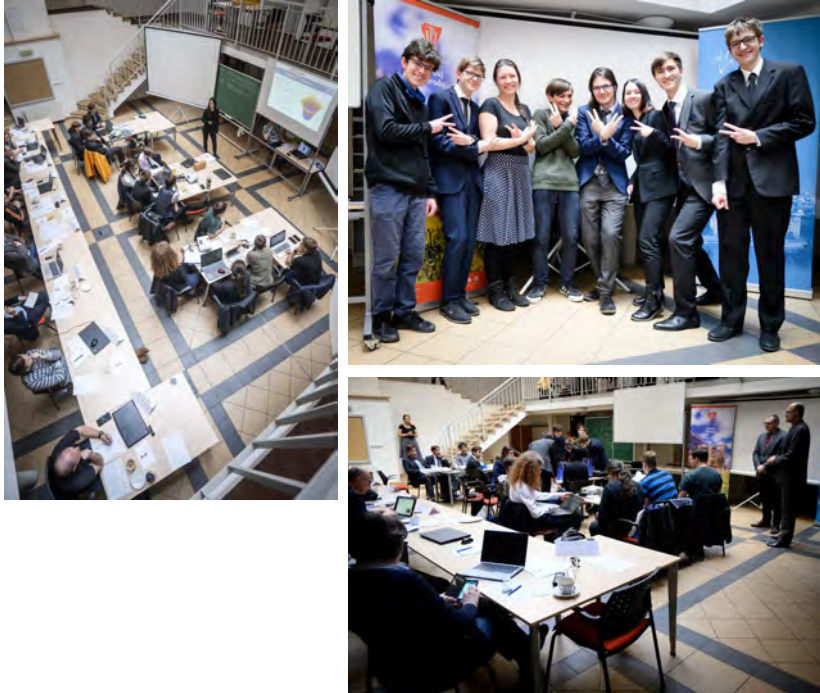
Obr. 2: Záznam z průběhu ústředního kola 35. ročníku TMF na FJFI ČVUT v Praze.

budou odpuštěny přijímací zkoušky, a od příštího ročníku jim navíc bude i vyplácet prospěchové stipendium. Student tak dosáhne na toto stipendium již od prvního ročníku, zatímco jeho kolegové, kteří mají vynikající studijní výsledky („samá áčka“), až od ročníku druhého.